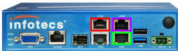
Схема портов криптошлюза:

Подключить кабель с выходом в сеть Интернет (порт OUT грозозащиты ИБП) в порт VipNet Coordinator HW100 помеченный на схеме зелёным цветом. Допустимо подключение порта VipNet Coordinator к офисной сети, при наличии из такой сети прямого выхода в сеть Интернет.