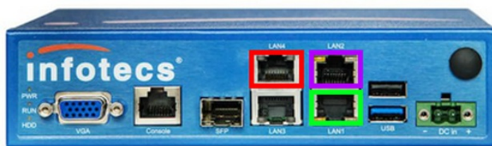
Схема портов криптошлюза:

Подключить кабель с выходом в сеть Интернет (порт OUT грозозащиты ИБП) в порт VipNet Coordinator HW100 помеченный на схеме зелёным цветом. Допустимо подключение порта VipNet Coordinator к офисной сети, при наличии из такой сети прямого выхода в сеть Интернет.