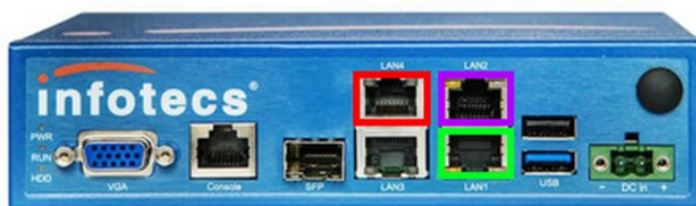
Схема портов криптошлюза:

Подключить кабель с выходом в сеть Интернет (порт OUT грозозащиты ИБП) в порт VipNet Coordinator HW100 помеченный на схеме зелёным цветом. Допустимо подключение порта VipNet Coordinator к офисной сети, при наличии из такой сети прямого выхода в сеть Интернет.