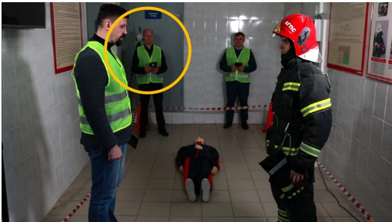
Пример ошибки. Второй слева эксперт перекрыл видеокамеру.

До начала экзамена обязательно проинструктировать участников об обязательности громкого и четкого озвучивания всех этапов проведения для качественной видео/аудио регистрации.