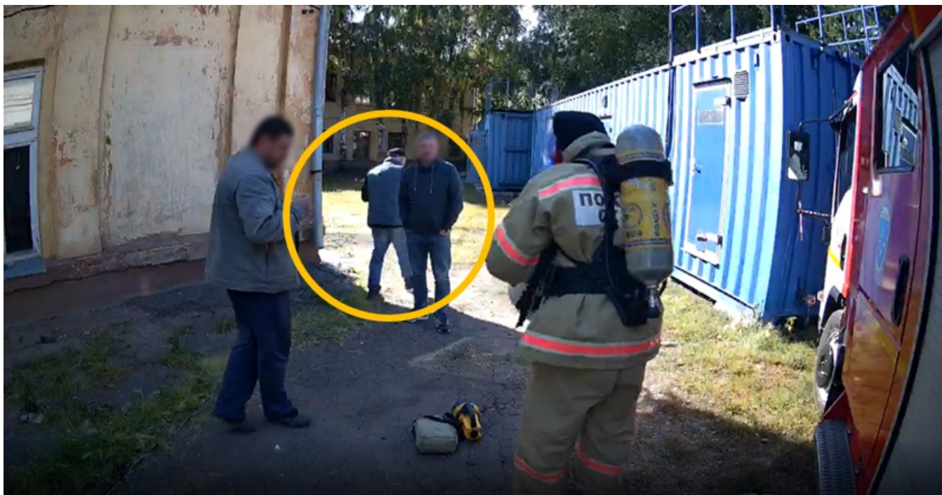
Пример ошибки. Один из экспертов отвлекся во время выполнения соискателем задания.

От момента начала и до завершения последнего действия эксперты обязаны непрерывно следить за действиями соискателя.