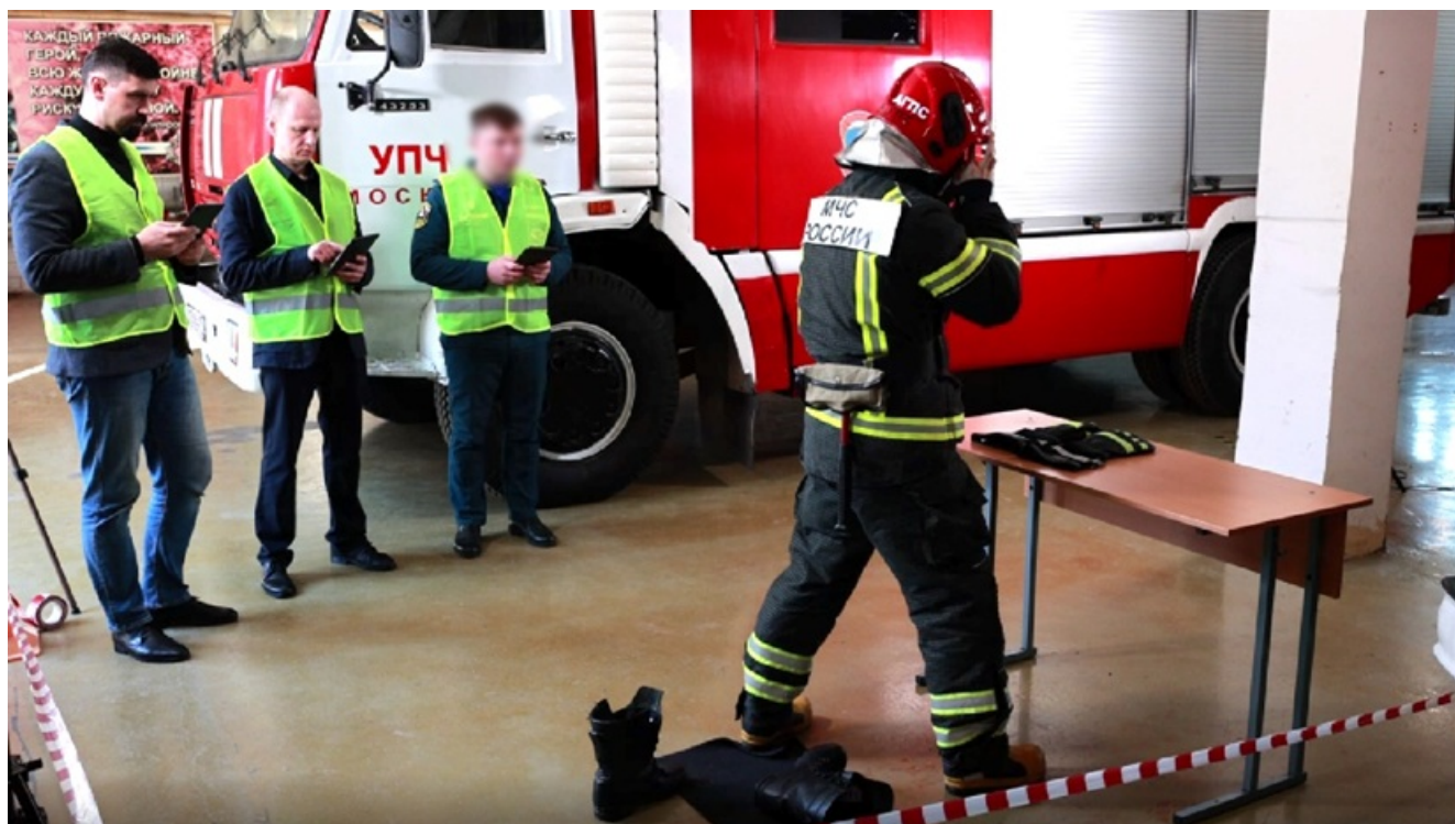
Пример разметки площадки. Пространства достаточно для выполнения задания соискателем и размещения экспертов. Камеры качественно фиксируют происходящее.