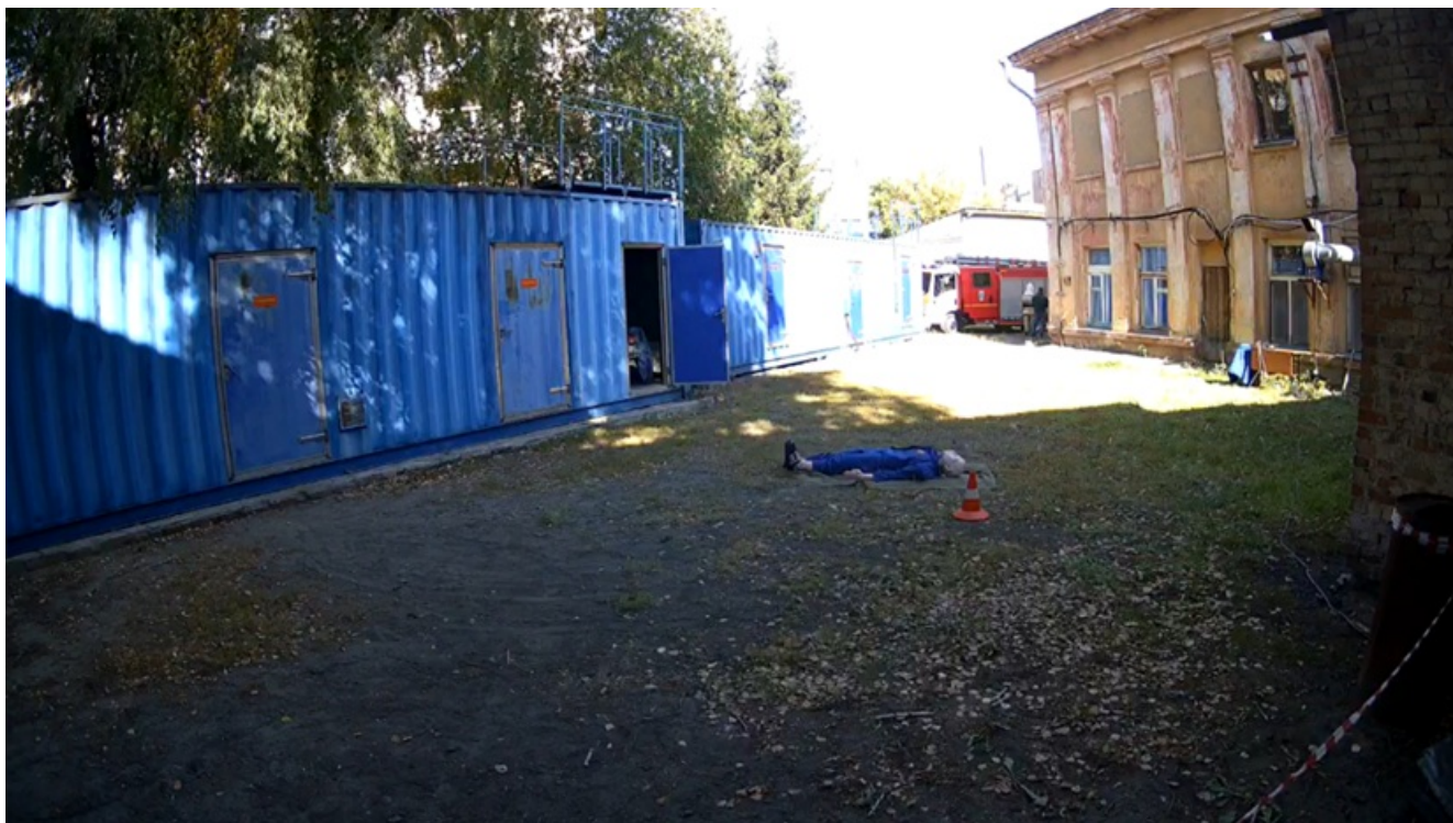
Пример ошибки. Камера установлена далеко от места оказания первой помощи.