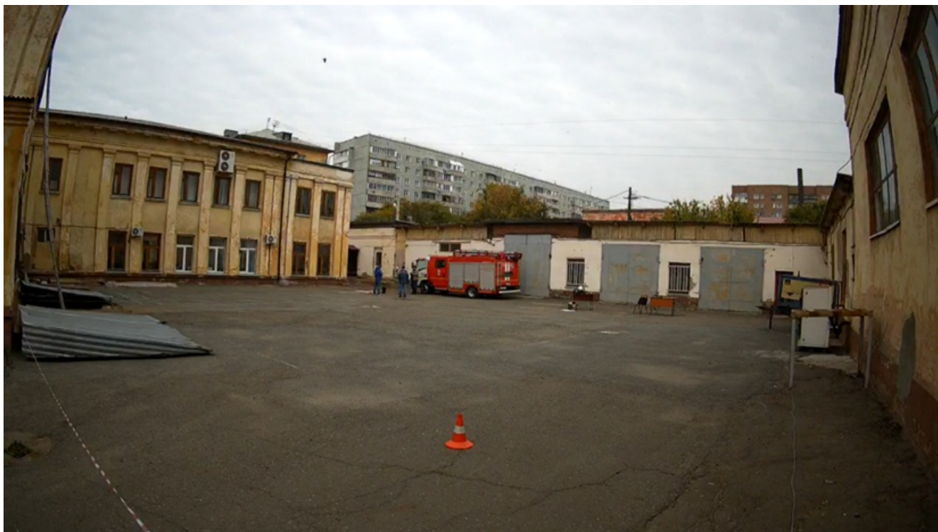
Пример ошибки. Камера расположена далеко от соискателя.

[Решение] Подобная ошибка может быть вызвана избыточной зоной разметки. В результате камеры устанавливаются на большом расстоянии, что значительно снижает качество результирующей записи. Также до начала экзамена рекомендуется провести анализ ожидаемых действий соискателя и установить камеры в наиболее удобных ракурсах и по возможности ближе к наиболее важным точкам. Возможно для этого уменьшить площадь разметки площадки.