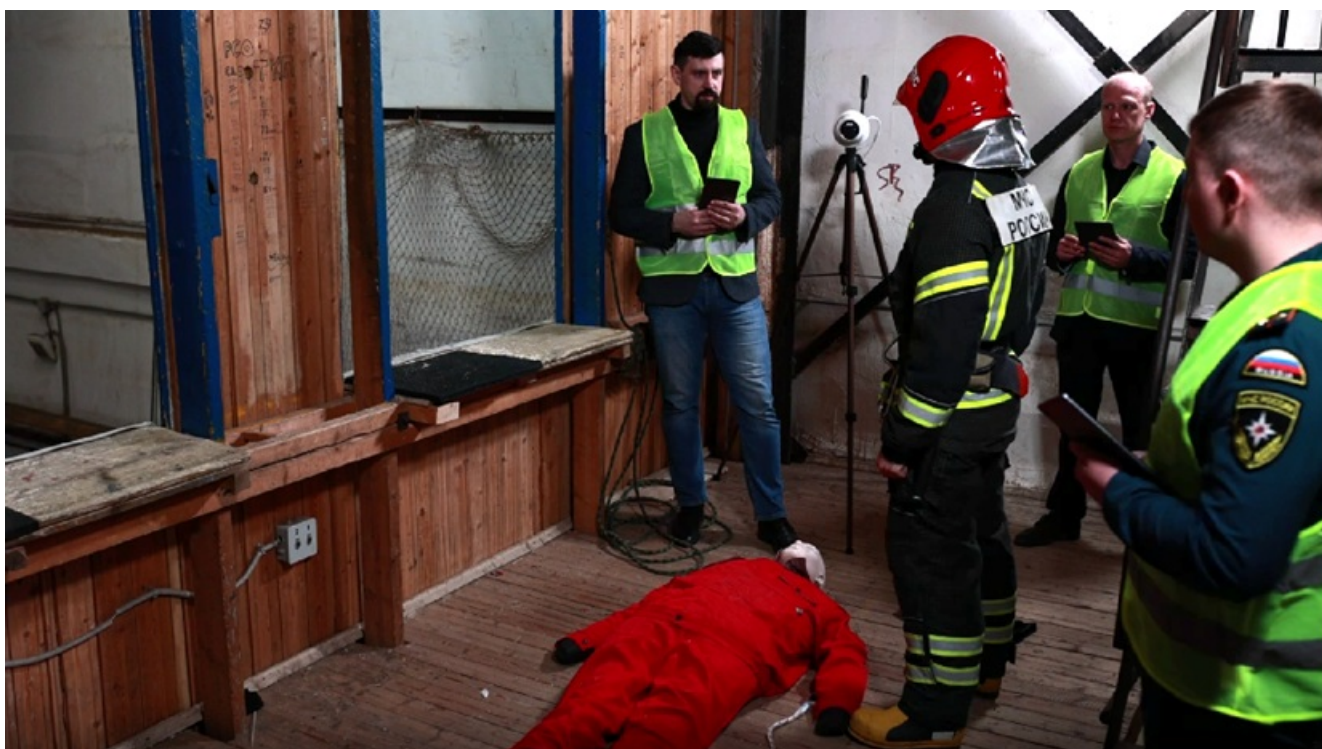
Пример правильной установки. Камера установлена на верхнем этаже учебной башни, где происходит главная часть этапа.

До момента начала экзамена произвести анализ размещения участников экзамена и необходимых путей их перемещения. Если возможно перекрытие кадра – изменить расстановку камер либо исходное размещение экспертов. Проинструктировать экспертов о необходимости избегания перекрытия камер во время экзамена.